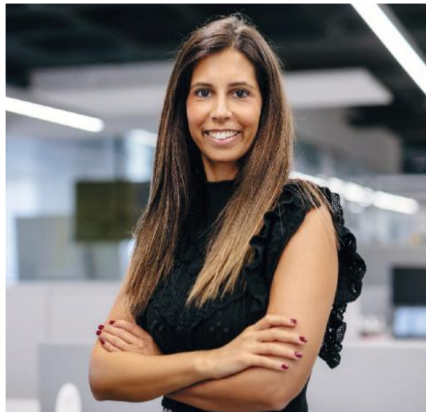
do gabinete e reforça a presença de Alvaiázere em cargos de responsabilidade no Ministério das Finanças.

A nomeação inclui funções de substituição do chefe